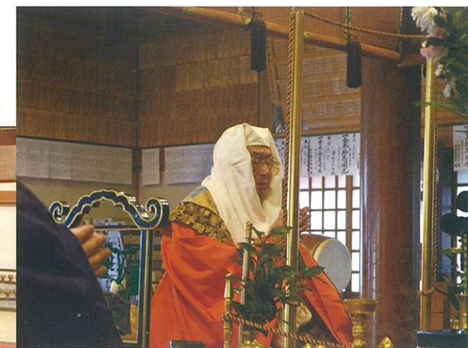
知行院 法類組寺住職出仕により本堂で本尊に奉告の法楽