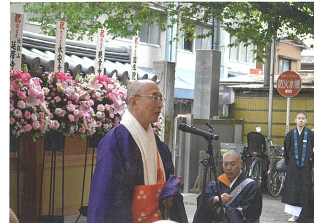
お祝いの言葉を述べる天台宗宗務総長杜多道雄大僧正