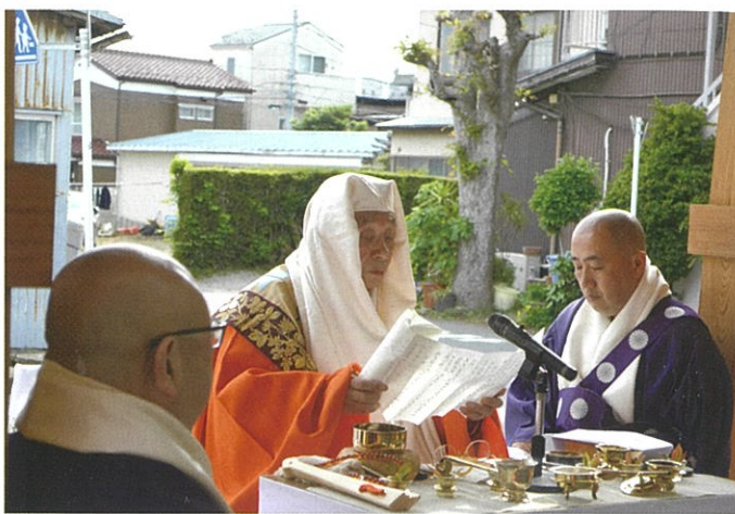
導師を務める探題大僧正