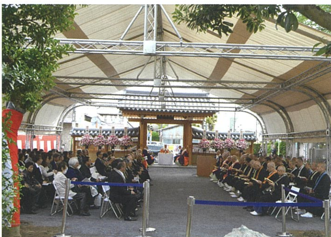
大テントに集った150人の参列者