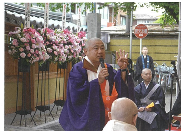
感謝の言葉を述べる知行院住職