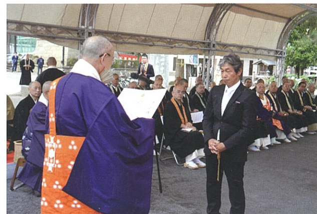
天台宗から(株)石野瓦店に感謝状を贈呈