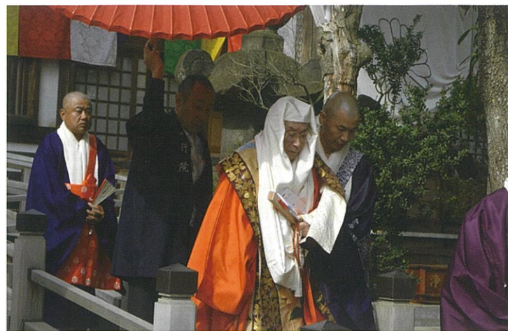
本堂から山門へ進む探題大僧正